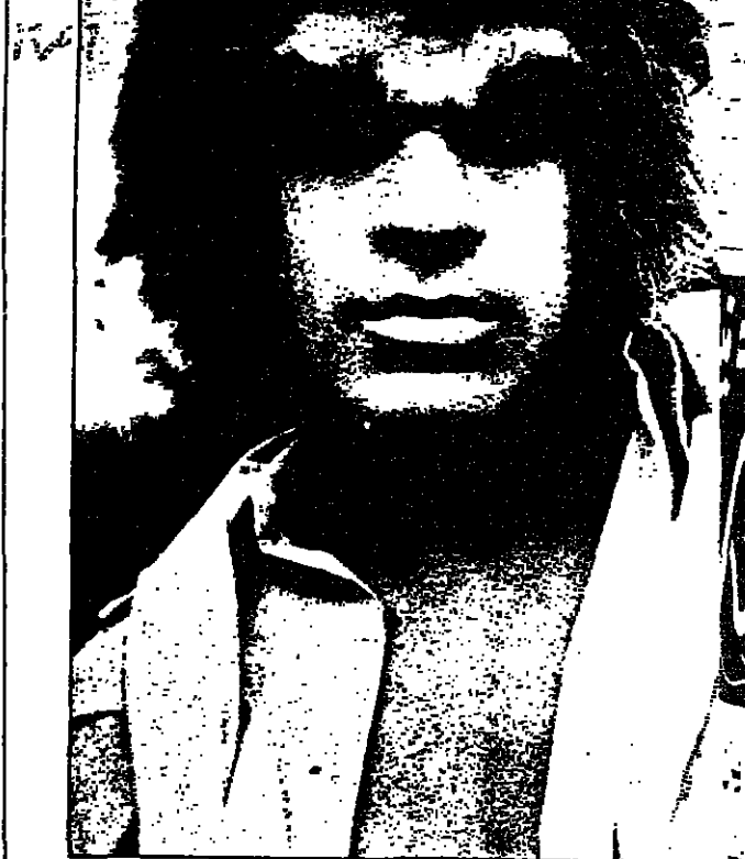
رأى التي تساوي ٤٠ كالج !!

وهذا كله لا يأس به ، بشرط ان يلتزم السلطان هذه القوانين «المطلة من الله» - المترلة - ، ولكن لتفرض انه يستغل سلطته غير المحدودة ليهزم بهذه القوانين ويسخر منها .. نالما تكون النتيجة ؟ - يتبع -